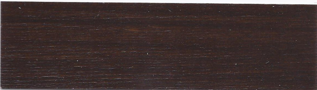
Tinta noce brennero - Brenner walnut - Farbton Brenner Nussbaum - Teinte Noyer Brenner - Color Nogai Brennero