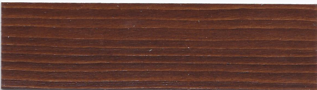
Tinta mogano - Mahogany - Farbton Mahagoni - Teinte acajou - Color Caoba