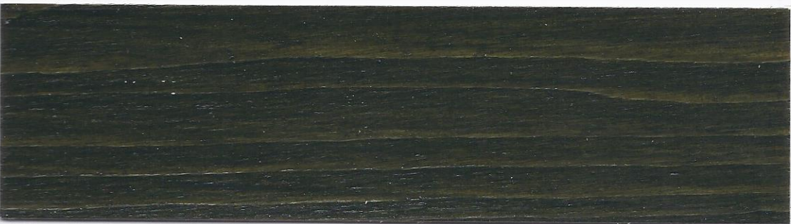
Tinta verde - Green tint - Farbton Grün - Couleur Vert foncé - Color Verde